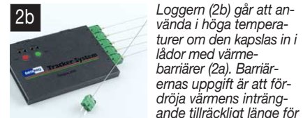
Loggern (2b) går att använda i höga temperaturer om den kapslas in i lådor med värmebarriärer (2a). Barriärernas uppgift är att fördröja värmens inträngande tillräckligt länge för att resan genom ugnen

och mätningen ska hinna avslutas. Idag finns radioöverföring av mätdata för realtidsstudier.